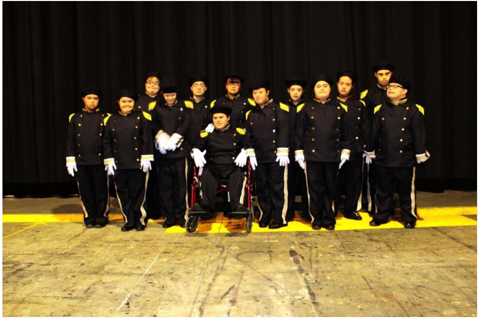
Nuevo uniforme de la Banda de guerra y escolta.