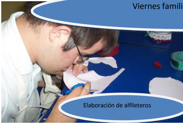
Elaboración de alfileros