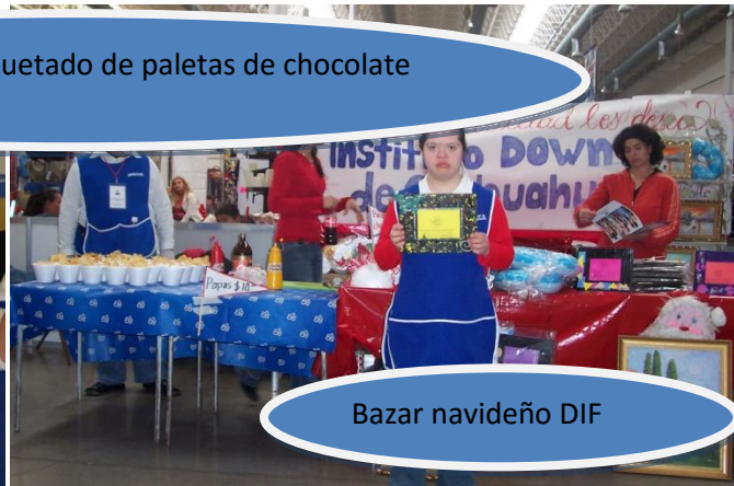
Bazar navideño DIF