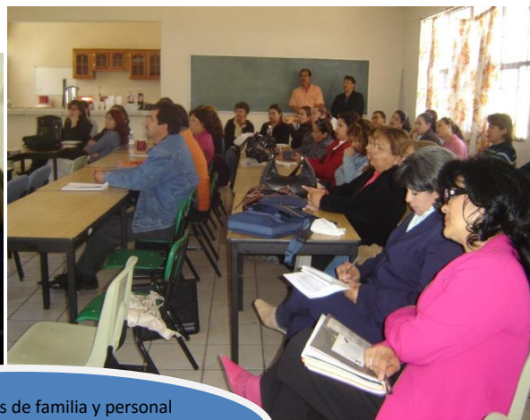
Trabajo con padres de familia y personal docente de Cd. Ojinaga