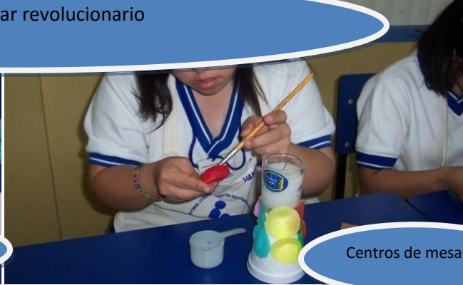
Centros de mesa