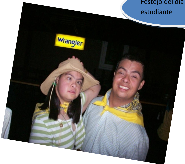
Festejo del día del estudiante