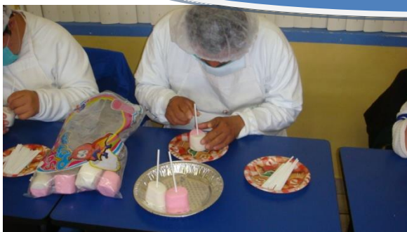
... y empaquetado de paletas de chocolate